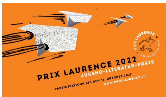
Dépliant Prix Laurence 2022