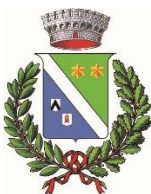
Logo Commune de Flaibano (Italie)