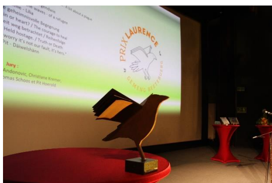
Trophée Prix Laurence