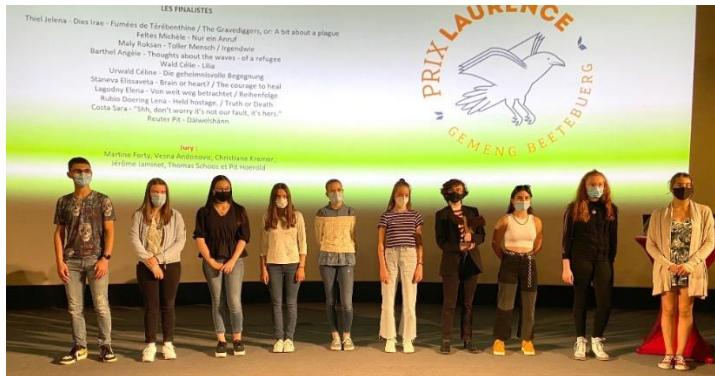
Prix Laurence 2020 – Finalistes catégorie 12-17 ans