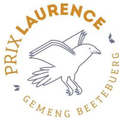
Logo Prix Laurence

Disponibles sur demande à rp@bettembourg.lu