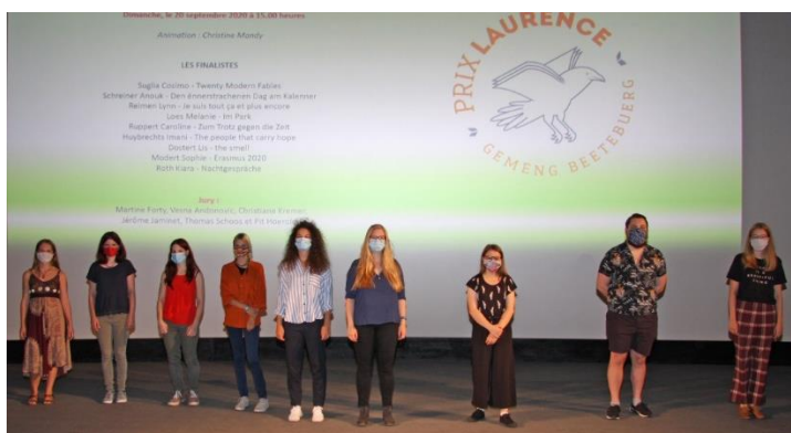
Prix Laurence 2020 – Finalistes catégorie 18-26 ans