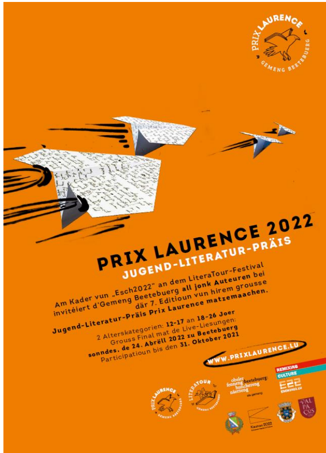
Affiche Prix Laurence 2022