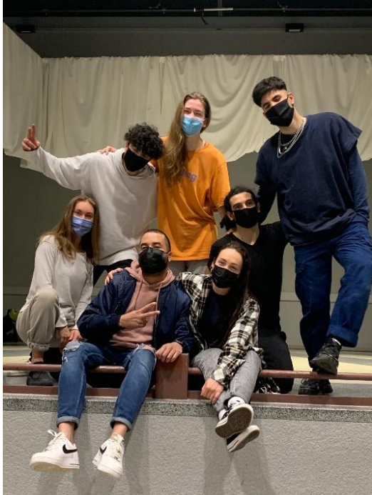
Ensemble « Make Your Move »

Plus de photos disponibles sur le site www.prixlaurence.lu .